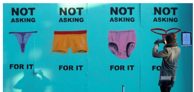
#estonoconsentimiento. Meme de arte callejero, Irlanda, 2017

La violencia sexual, incluida la violación, no tiene que ver con el sexo o con la satisfacción del deseo sexual, es una forma de ejercer poder y control sobre la víctima. Los violadores son perfectamente capaces de controlar su deseo y no participar en ninguna actividad sexual de forma espontánea controlados por su propio impulso sexual. (En respuesta a: “Las agresiones sexuales son actos de pasión y lujuria que no se pueden controlar”).