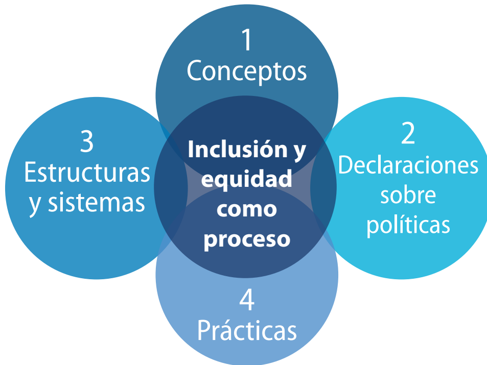
Figura 1. Dimensiones del marco de revisión de políticas

La investigación internacional ha determinado cuatro dimensiones superpuestas como claves para establecer sistemas educativos inclusivos y equitativos (Figura 1). En esta sección se explican estas dimensiones en detalle y se proporcionan ejemplos de iniciativas en diferentes partes del mundo que están contribuyendo a que los sistemas educativos sean más inclusivos y equitativos.